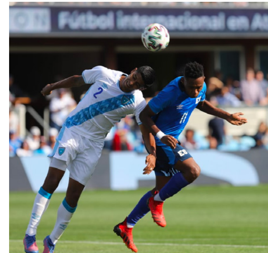
El juego del próximo sábado se disputará en el Finley Stadium de Chattanooga, Tennessee