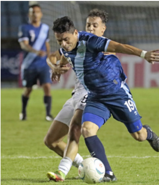
El partido ante Dominicana se realizará este 6 de junio en el estadio Cementos Progreso