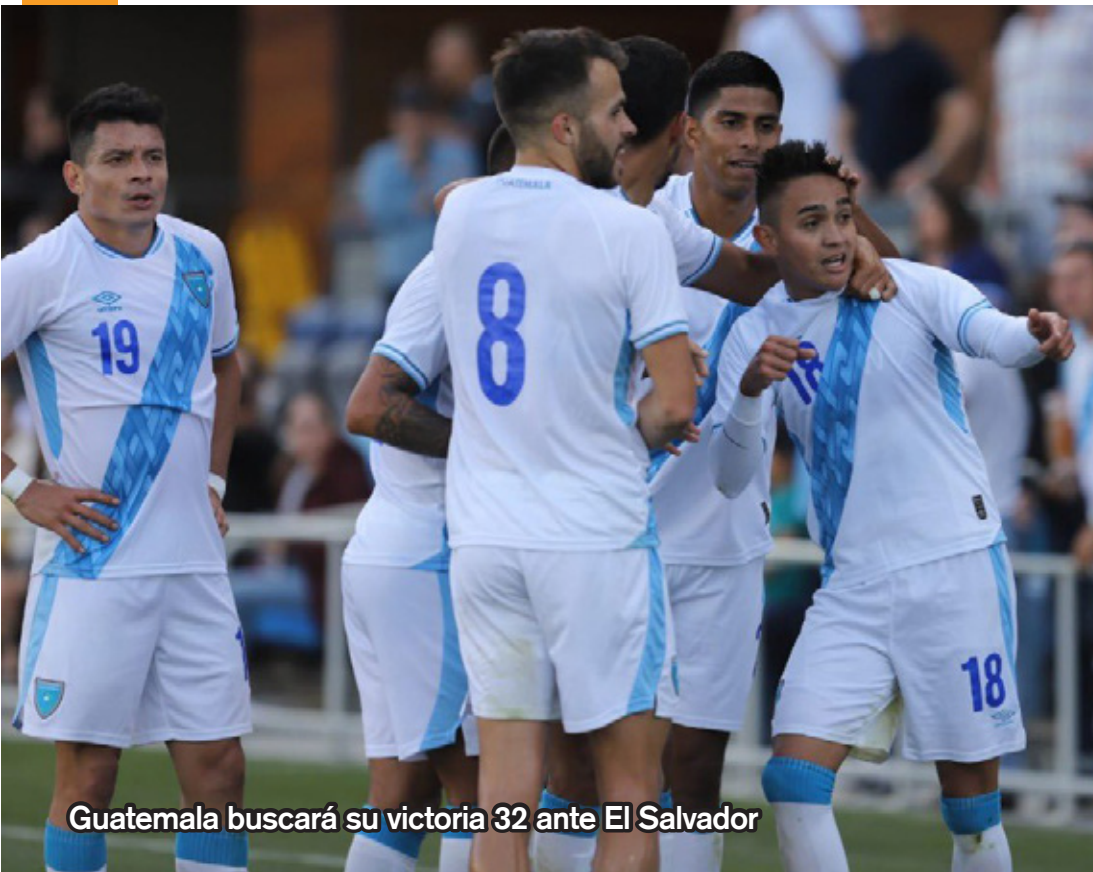
Guatemala buscará su victoria 32 ante El Salvador

Guatemala. La Selección Nacional de Guatemala confirmó un partido amistoso ante El Salvador en Estados Unidos, previo a que se disputen las eliminatorias mundialistas y la Copa de Oro 2025.