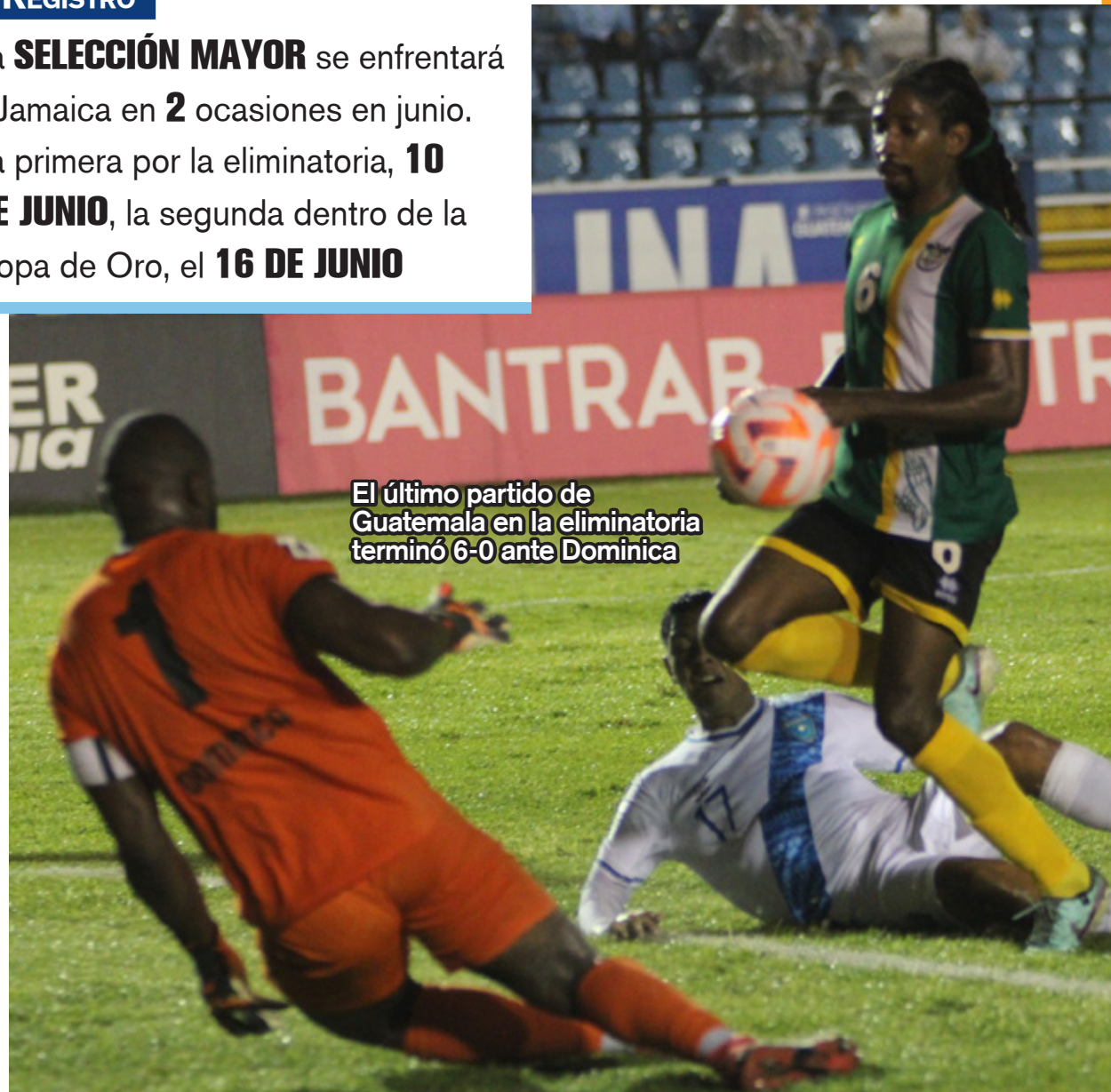
El último partido de Guatemala en la eliminatoria terminó 6-0 ante Dominica