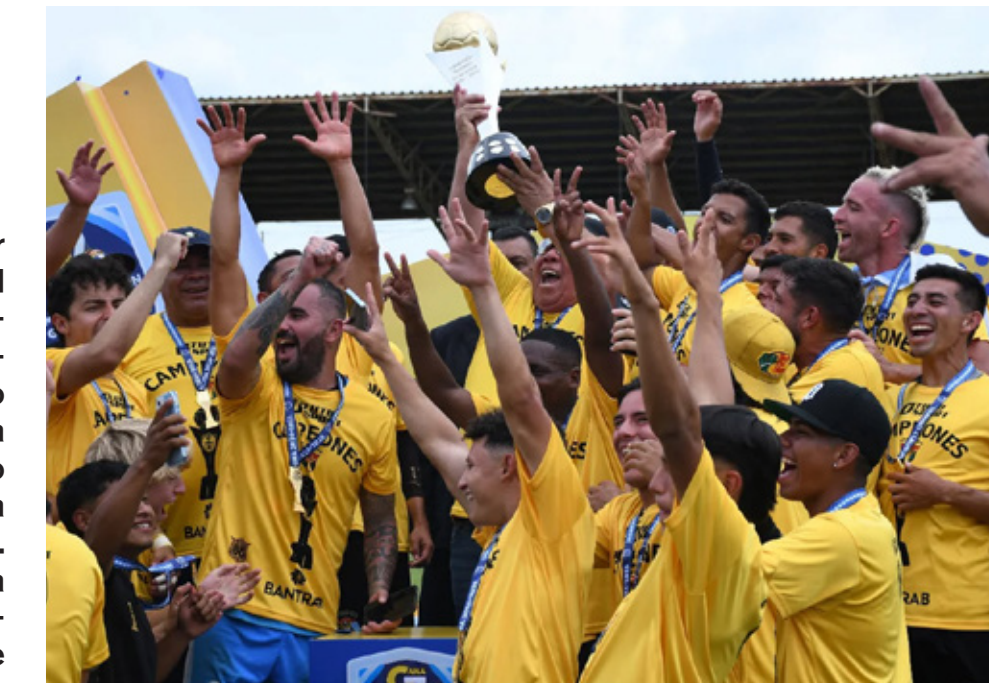
Aurora, con el título obtenido, jugará por el ascenso a la Liga Mayor ante Sacachispas de Chiquimula