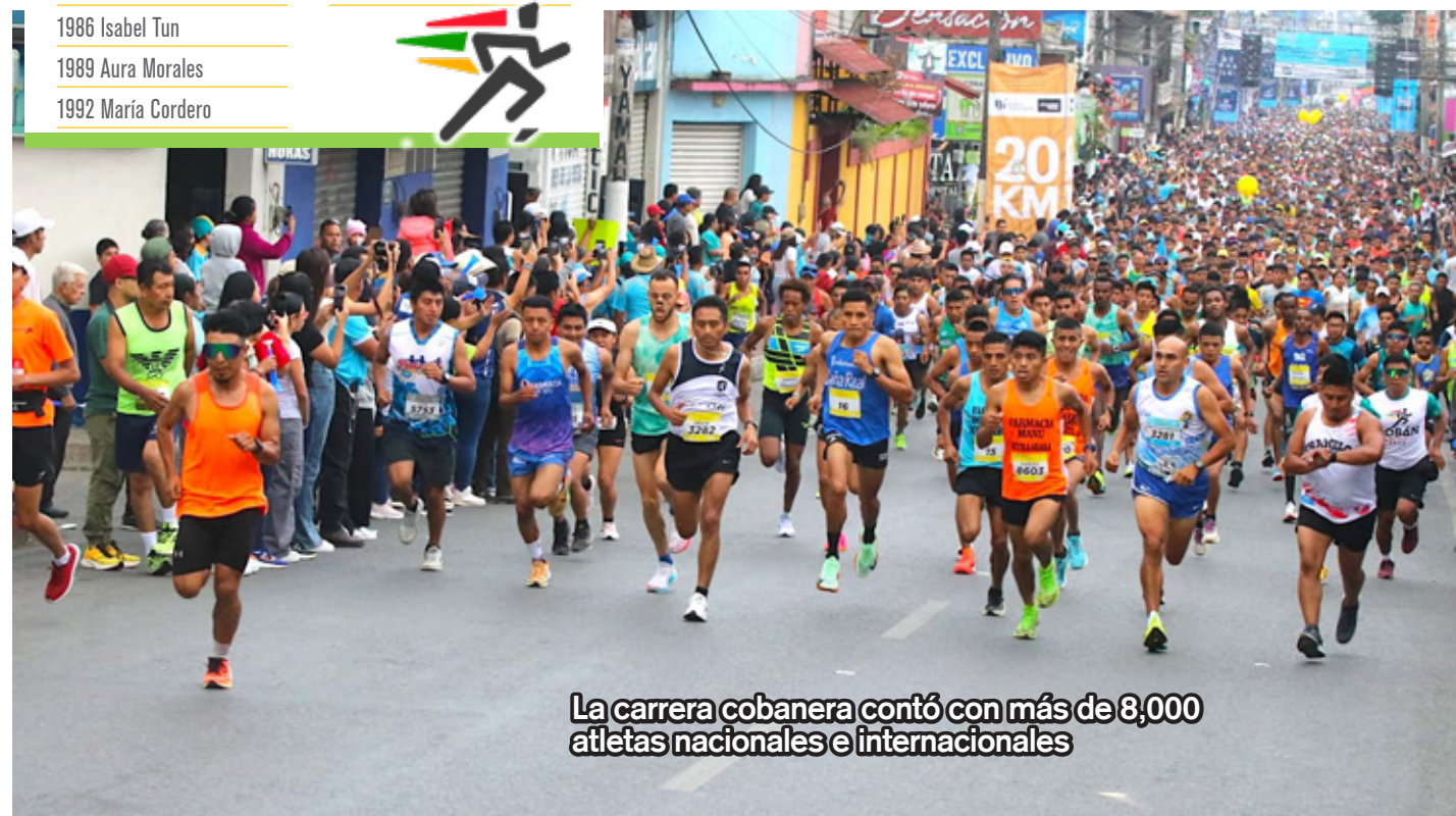
La carrera cobanera contó con más de 8,000 atletas nacionales e internacionales