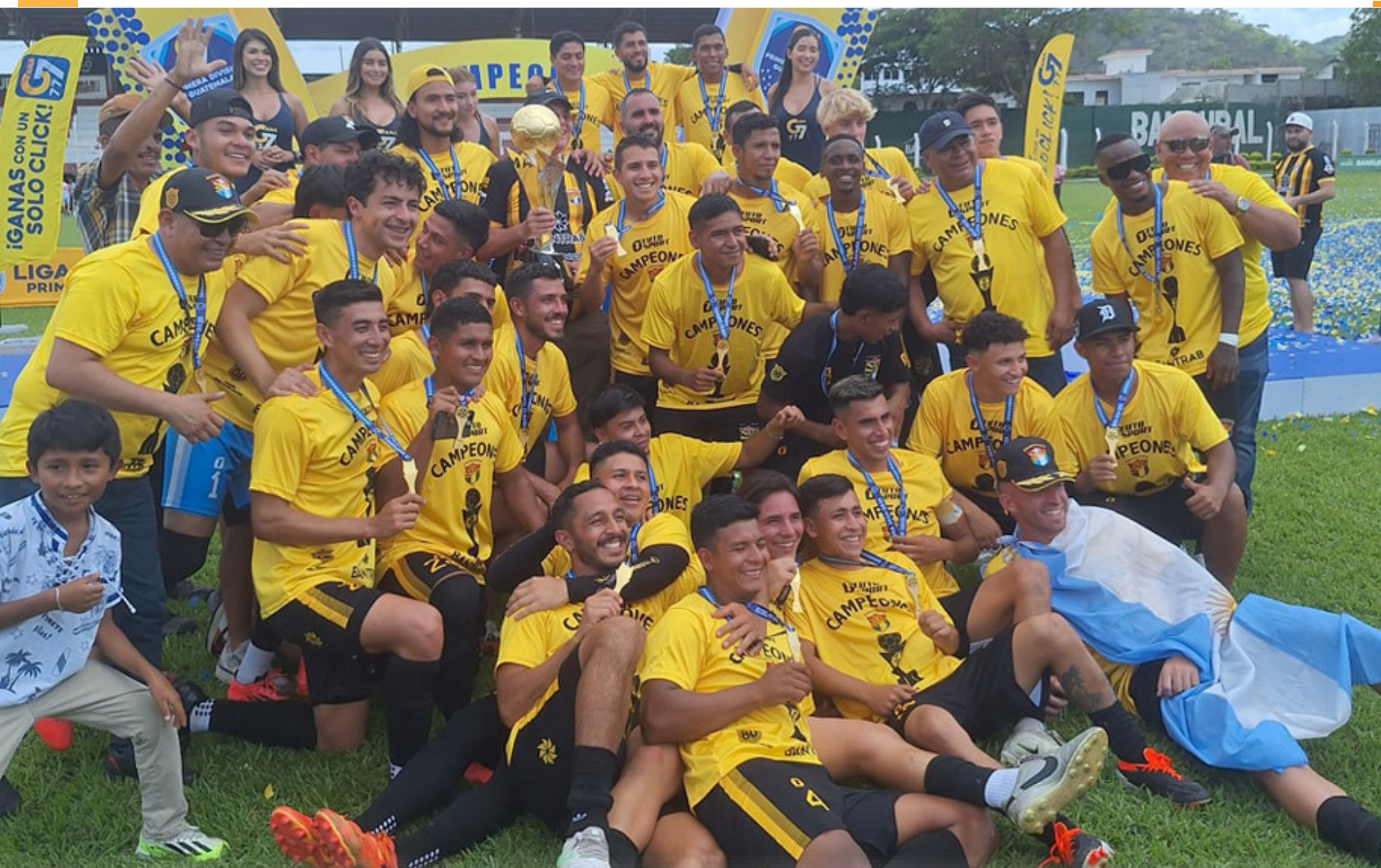
Aurora se quedó con el título de Campeón del Torneo Clausura 2025