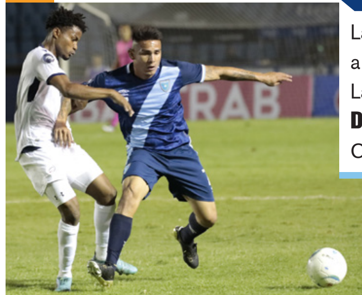
Si Guatemala gana ante República Dominicana quedaría con 9 puntos y mantendría el primer lugar del Grupo

La SELECCIÓN MAYOR se enfrentará a Jamaica en 2 ocasiones en junio. La primera por la eliminatoria, 10 DE JUNIO , la segunda dentro de la Copa de Oro, el 16 DE JUNIO