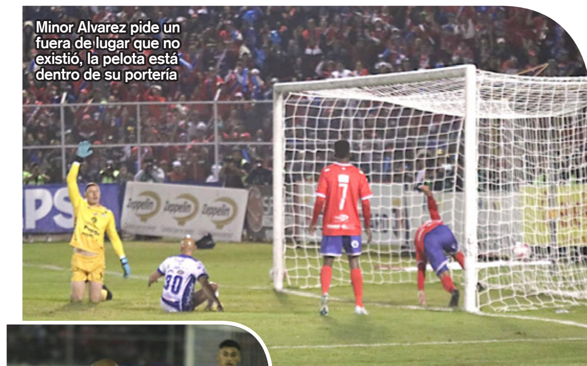
Minor Alvarez pide un fuera de lugar que no existió, la pelota está dentro de su portería