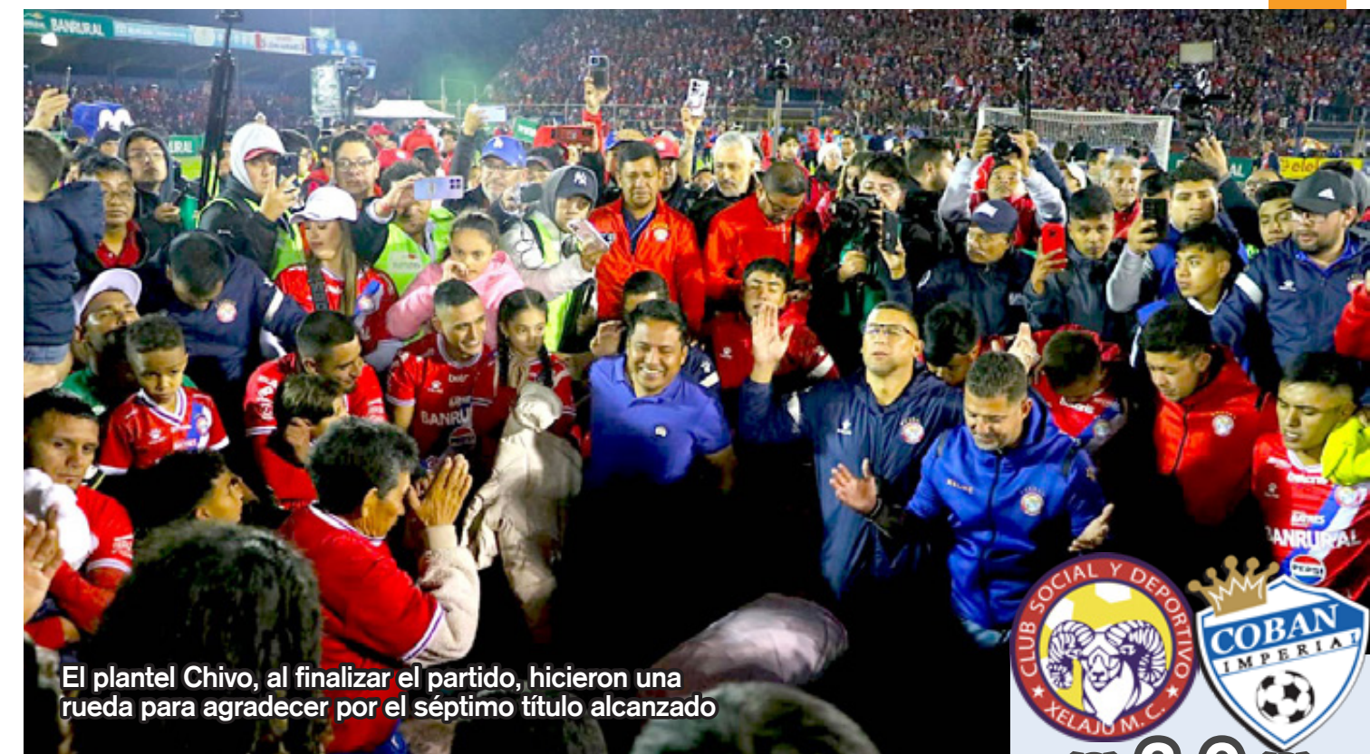
El plantel Chivo, al finalizar el partido, hicieron una rueda para agradecer por el séptimo título alcanzado