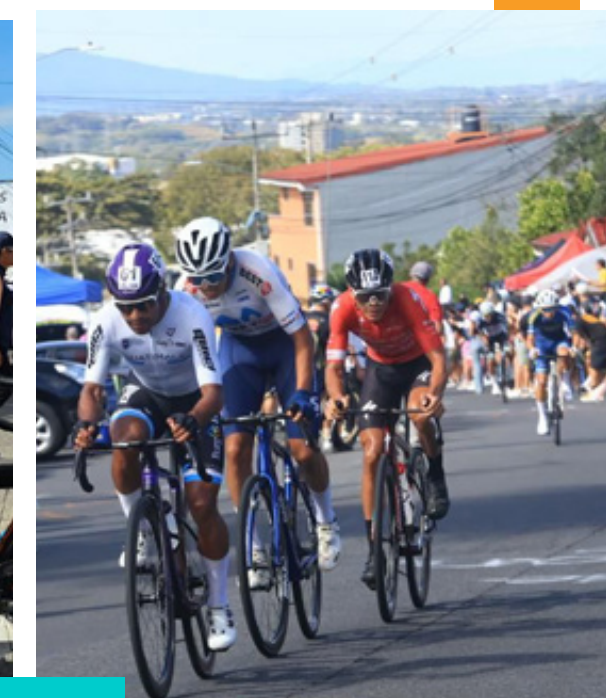
Chumil estuvo entre los primeros tres puestos de la última etapa