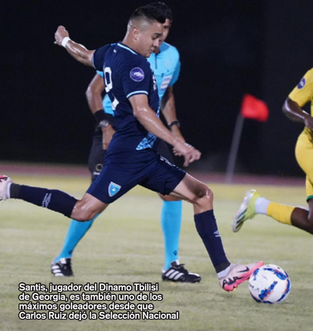
Santis, jugador del Dinamo Tbilisi de Georgia, es también uno de los máximos goleadores desde que Carlos Ruiz dejó la Selección Nacional

JUEGOS suma el técnico Luis Fernando Tena al frente de la Selección Nacional desde el 2022