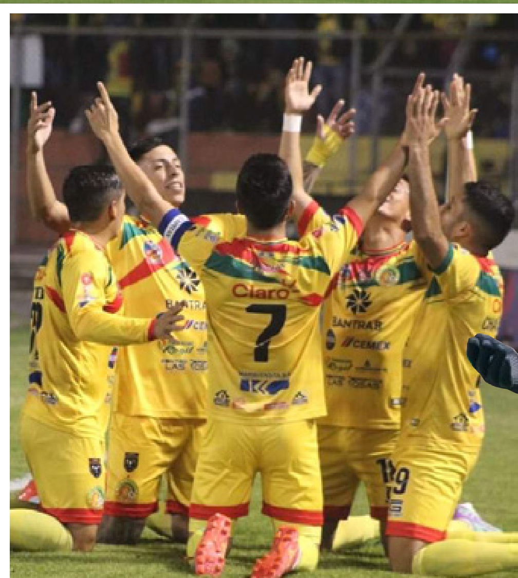
Marquense logró la victoria 2-0 en el juego de ida disputado en el estadio Marquesa de la Ensenada

Liga Nacional y lo hizo de manera consecutiva, ya que la temporada pasada lo hizo de la mano de los Zacapanecos. Marquense regresa