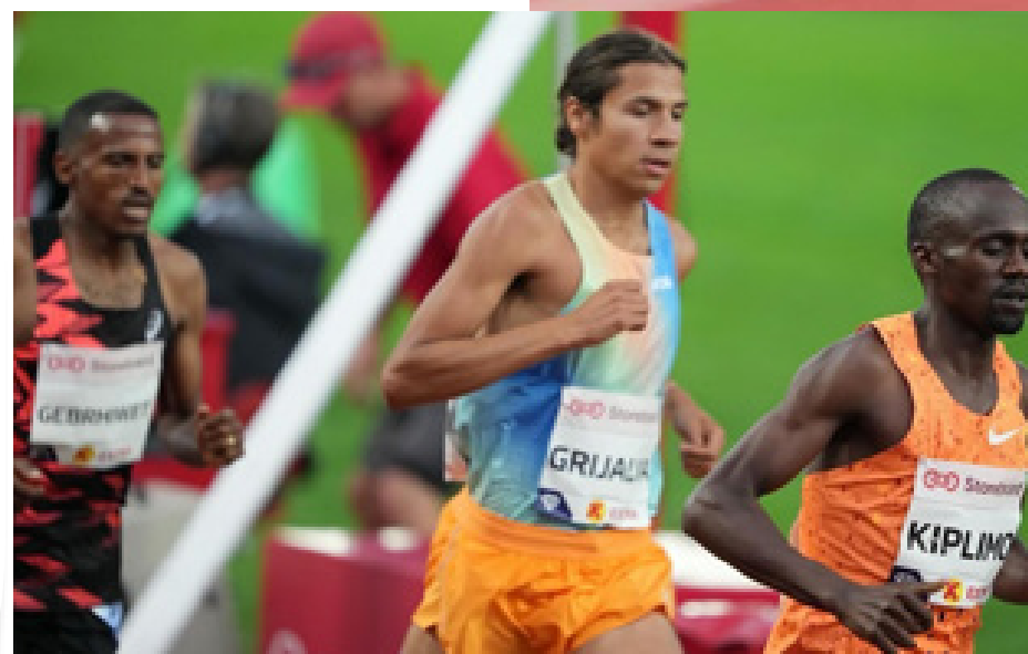
El atleta nacional es uno de los 11 guatemaltecos que competirán en los próximos Juegos Olímpicos

Ndikumwenayo (12.48.10) y Yihune (12.49.65) también terminaron dentro de 12.50. Fue apenas la segunda vez en la historia que 13 atletas hombres rompieron la barrera de los 13 minutos. Junto a Gebrhiwet, otros