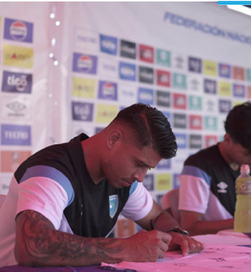
Los integrantes de la Selección Nacional tuvieron una firma de autógrafos para los aficionados en el Centro de Alto Rendimiento